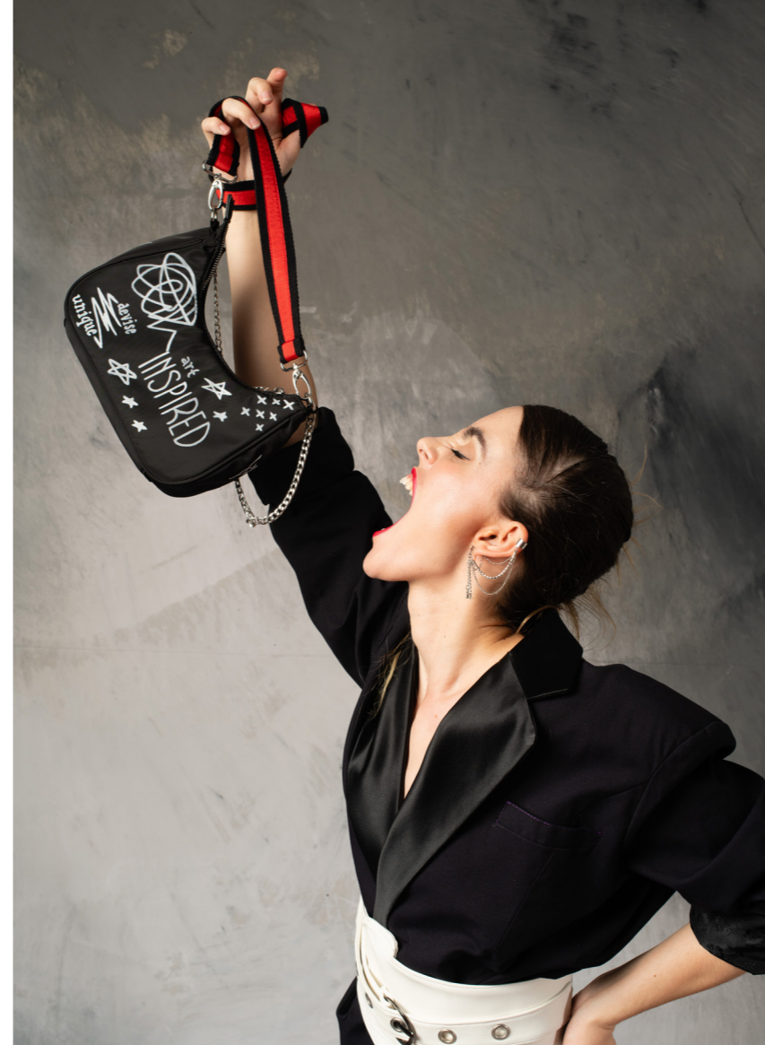
Modelo: @coco.evers