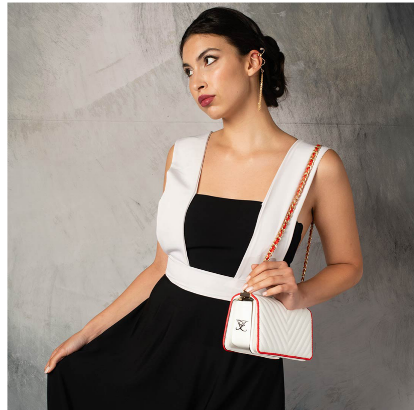
Modelo: @italktooomuch