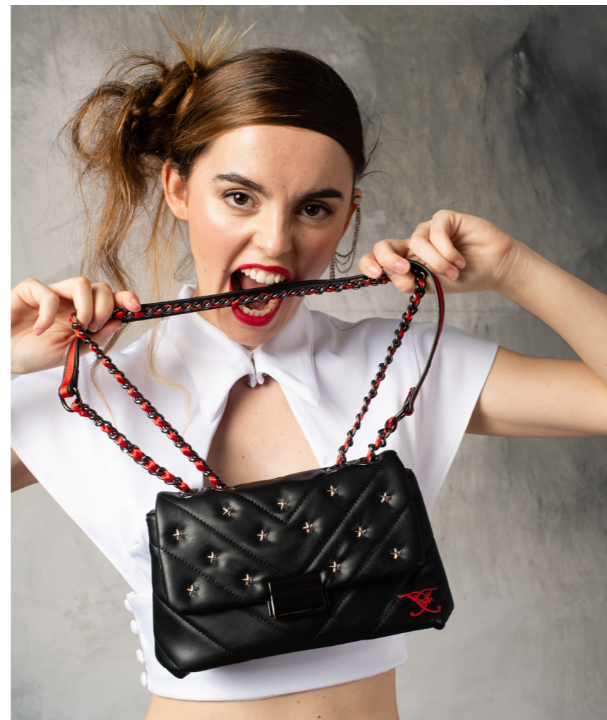
Modelo: @coco.evers