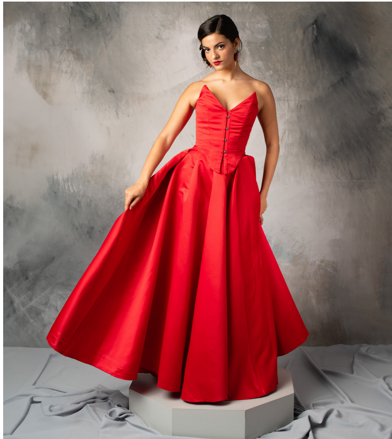
Modelo: @soydalia_