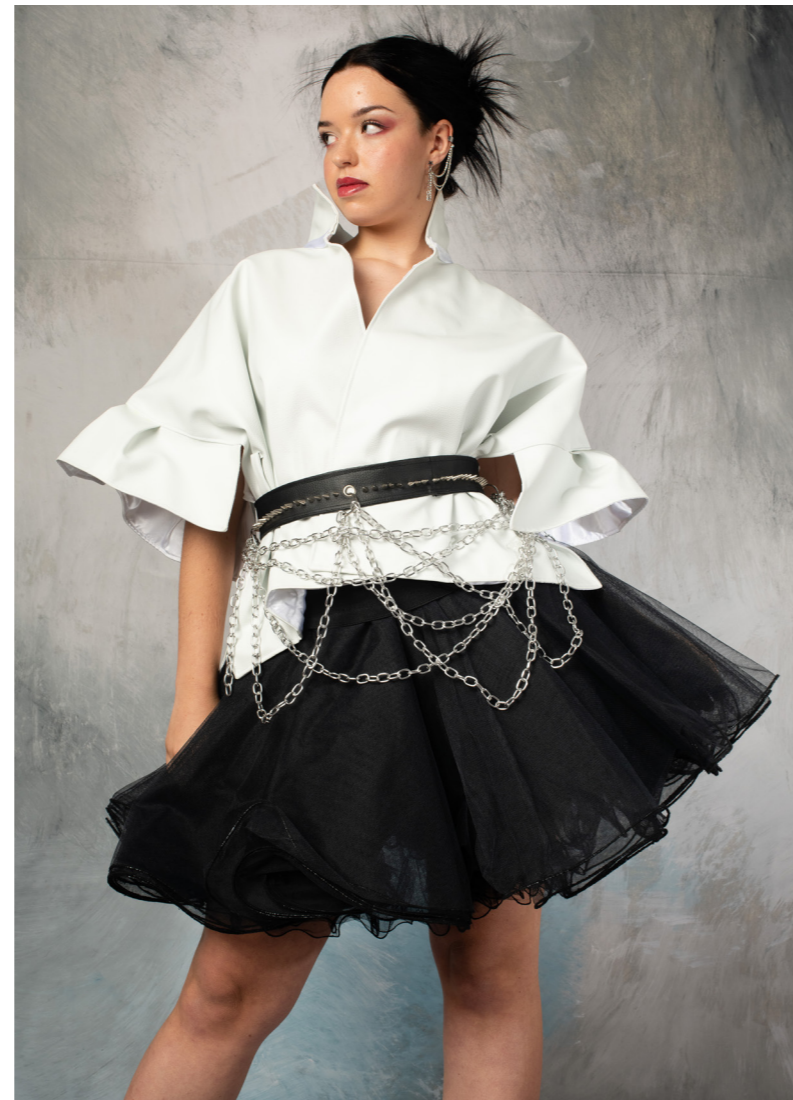
Modelo: @_lauraaalopezz_