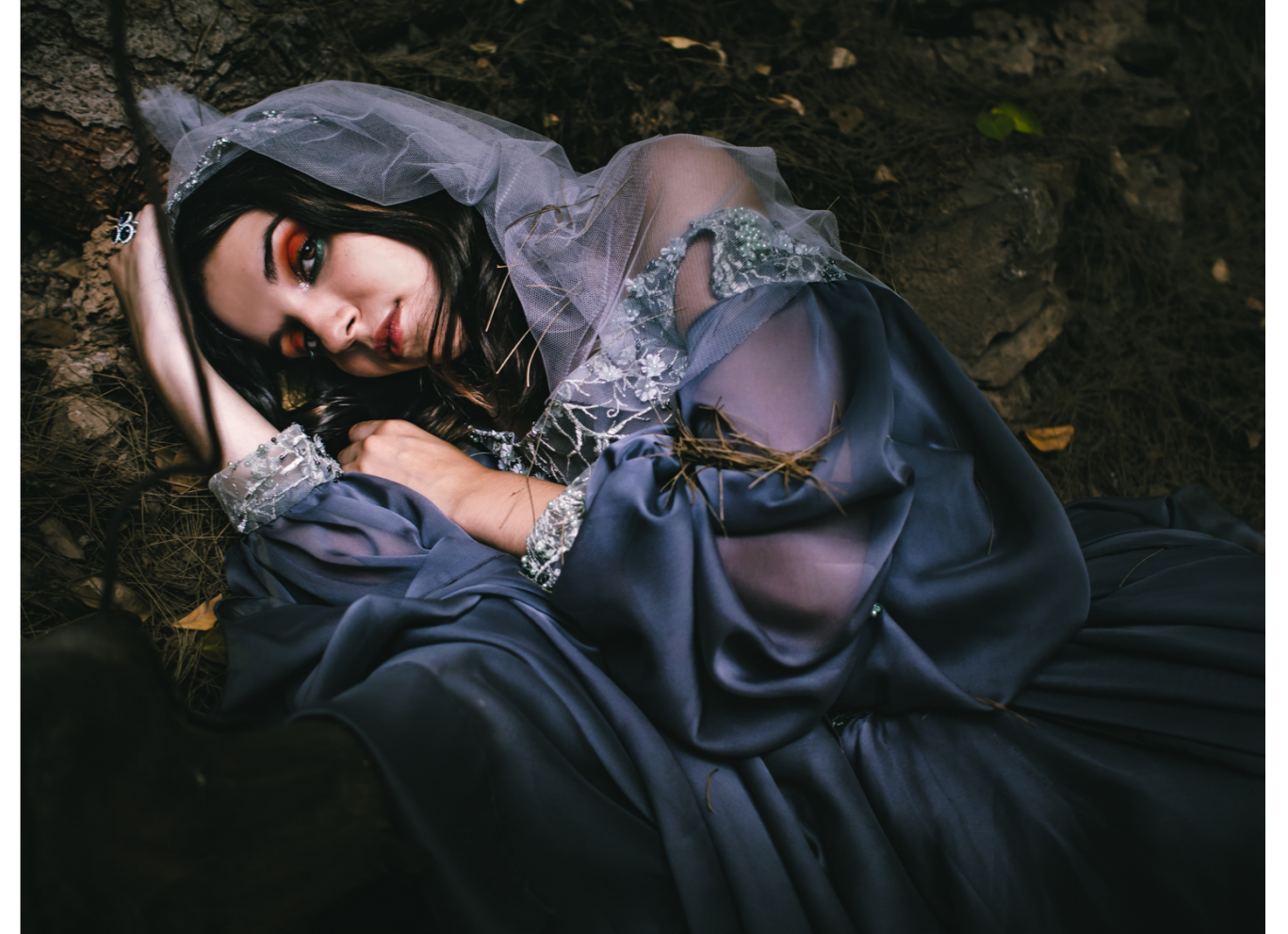
Modelo: @mariavilches__