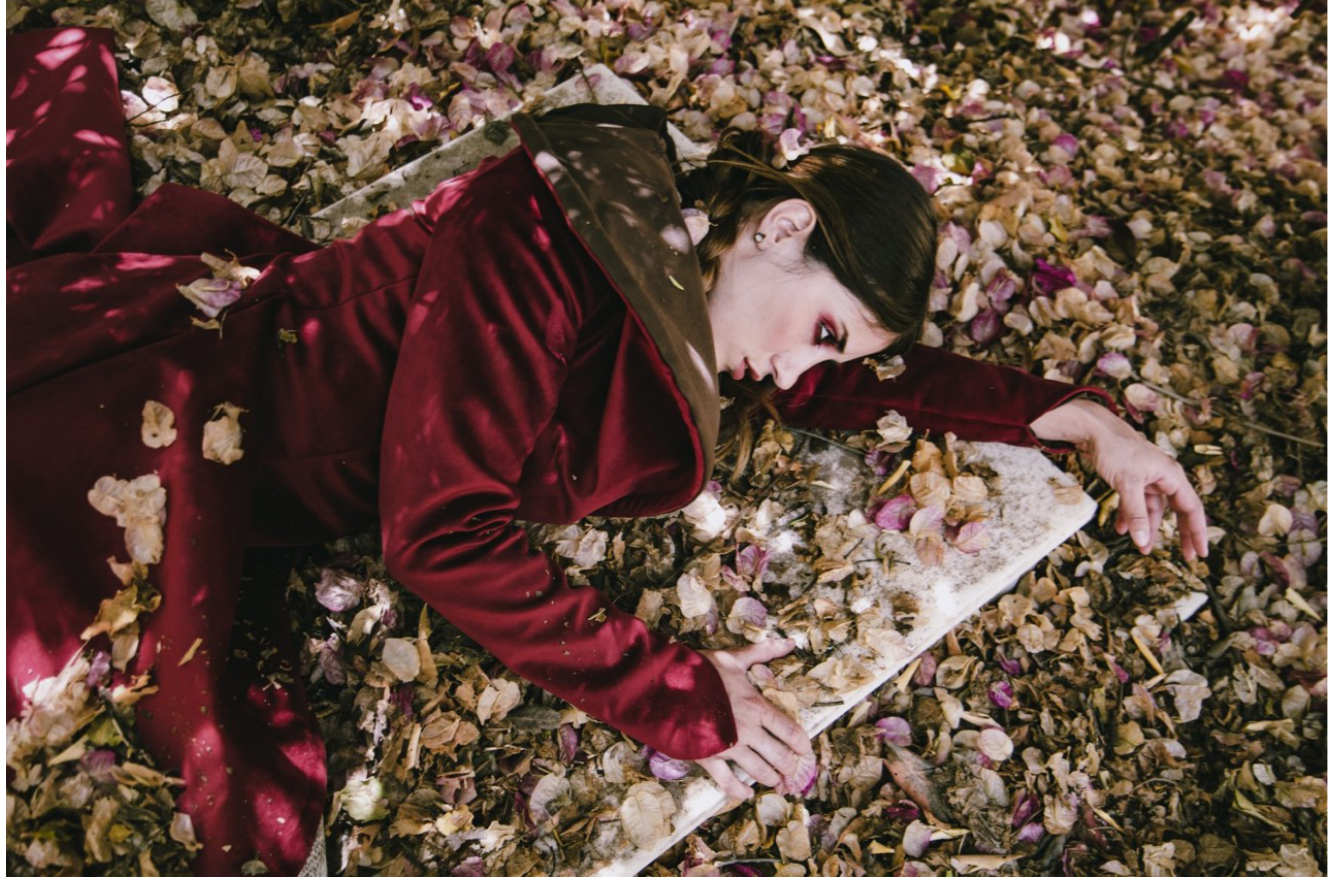
Modelo: @anto.tam